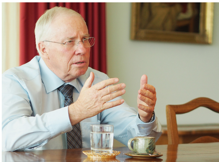
Christoph Blocher: La Suisse est aujourd'hui en meilleure position que les pays membres de l'UE

Si, mais uniquement dans les domaines où c'est utile et où il y a des intérêts communs. L'accord-cadre serait la fin de la voie bilatérale parce qu'il donne tous les droits à une seule partie – donc à l'UE. Mais nous autres Suisses, nous refusons de nous soumettre au diktat de Bruxelles.